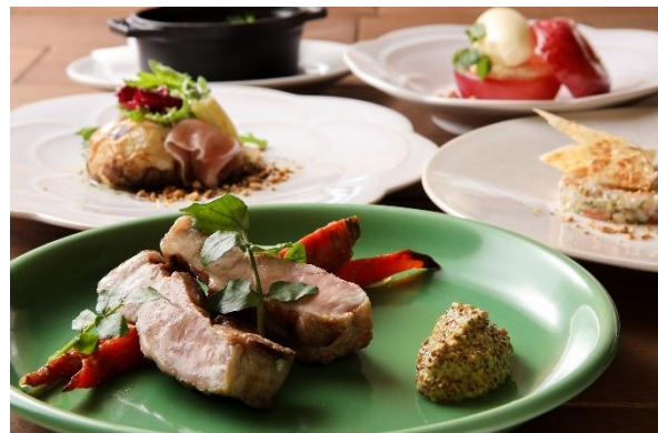
信州米豚肩ロース肉のグリル 金時人参のメイプルシロップグラッセ マスタード添え