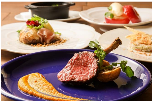
信州富士見ファーム 骨付き鹿肉のグリル ジャガイモのロースト クミン香る人参のピュレ