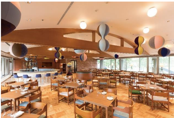
All Day Dining Karuizawa Grill