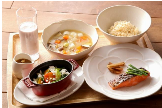
信州サーモンや発酵食品を使った朝食メニュー