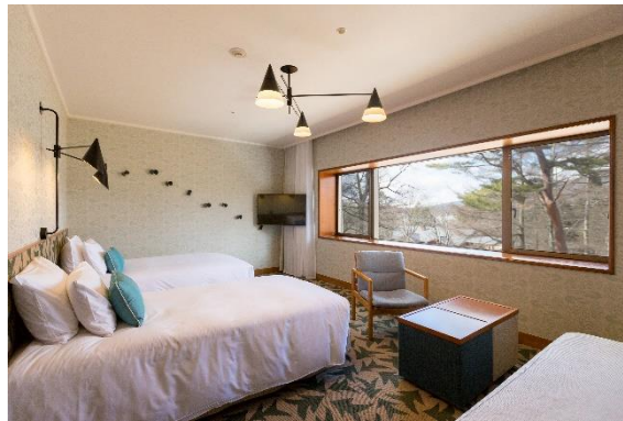
客室「フォレストツインルーム」